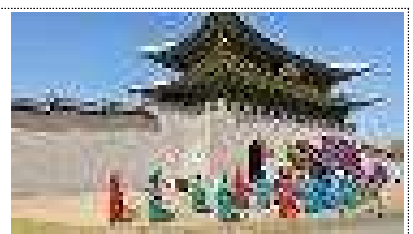
호텔인근 관광지 체험 또는 쿠폰 제공