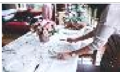
일정 내 식사(2식 이상) 포함