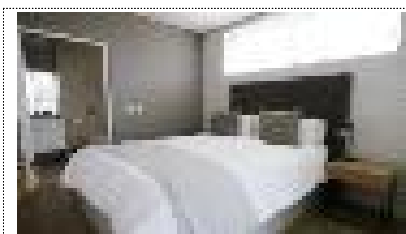
호텔 또는 리조트 1박 2일